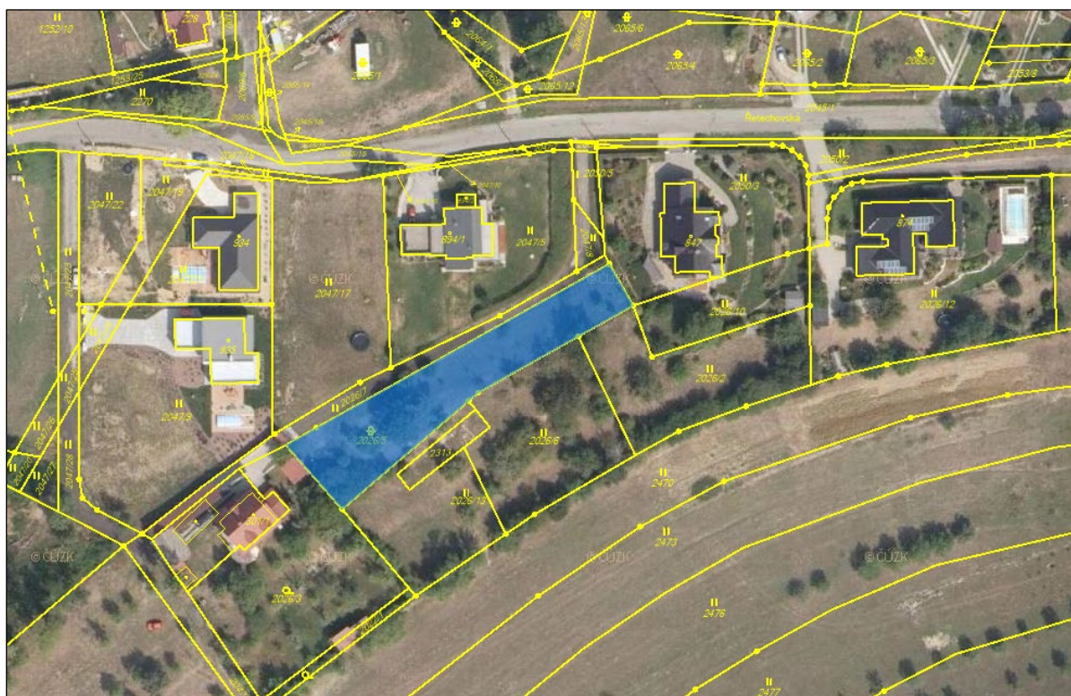
Obrázek 1: Nabízený pozemek parc. č. 2026/5 v obci a k.ú. Pozlovice