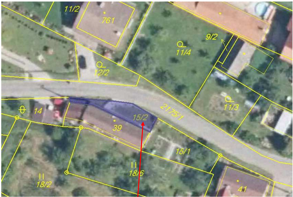
Pozemek parc. č. 15/2 v obci a k. ú. Pozlovice