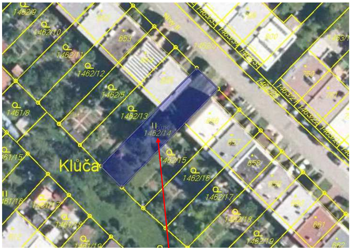
Pozemek parc. č. 1462/14 v obci a k. ú. Pozlovice