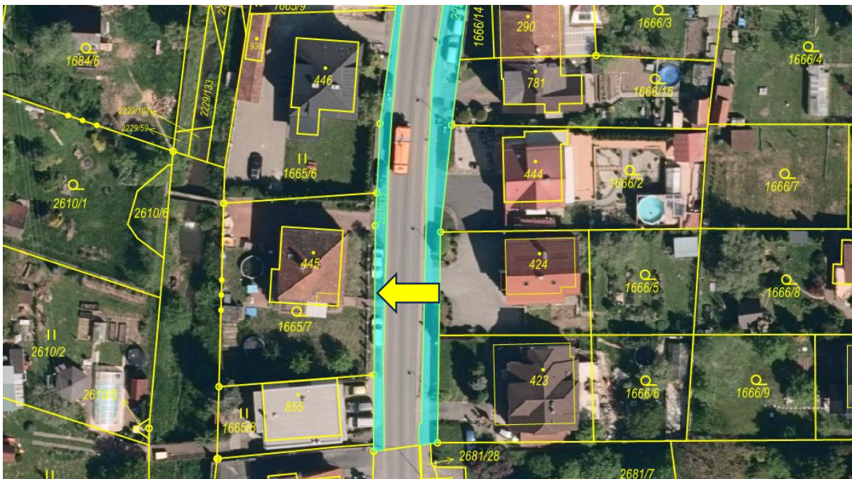
Obrázek 1: Zákres širších vztahů