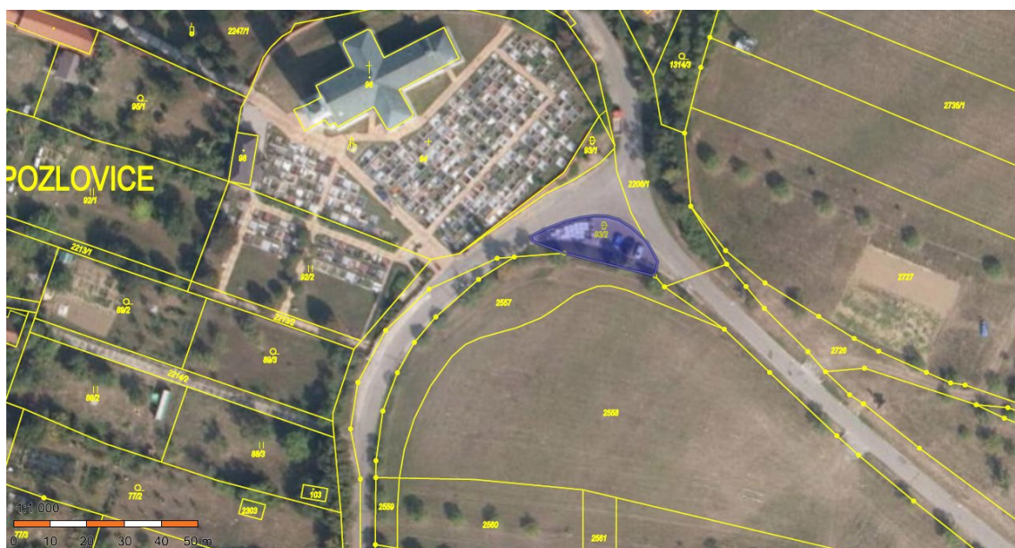
Část pozemků č.1