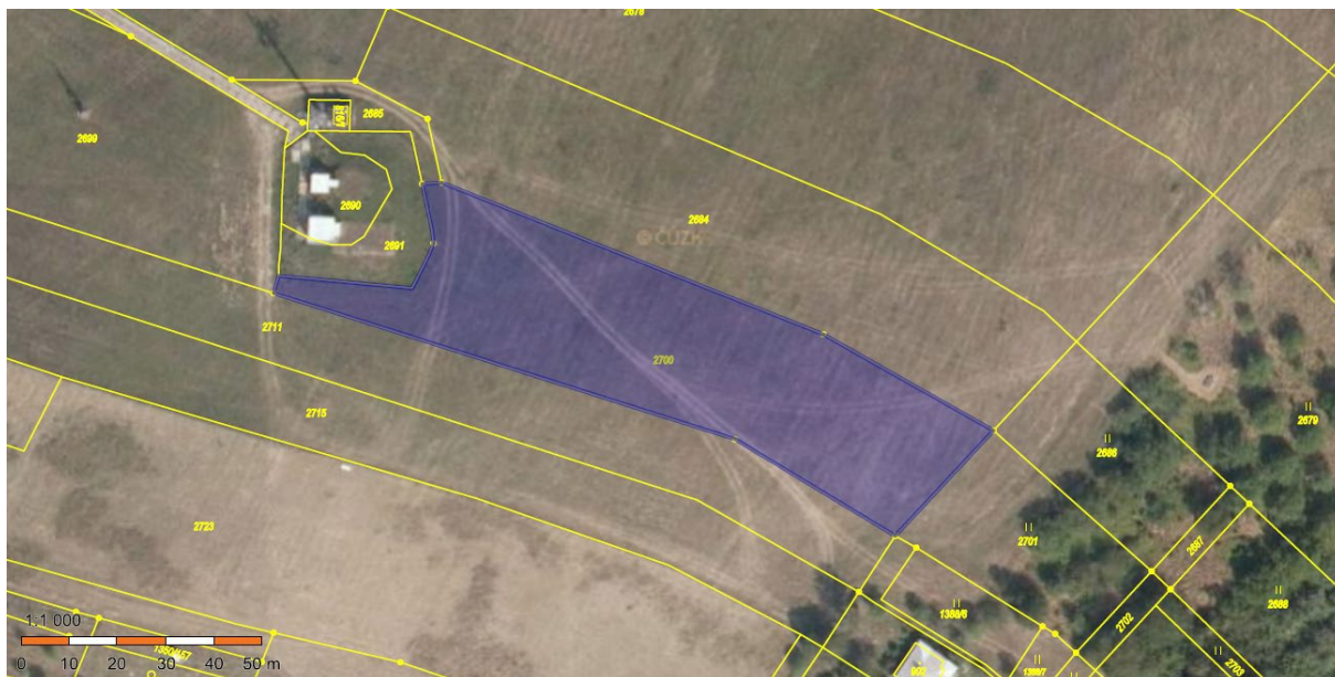
Část pozemků č.4

Městys Pozlovice v souladu s ust. § 39 zákona č. 128/2000 Sb., o obcích v platném znění oznamuje výše uvedený záměr.