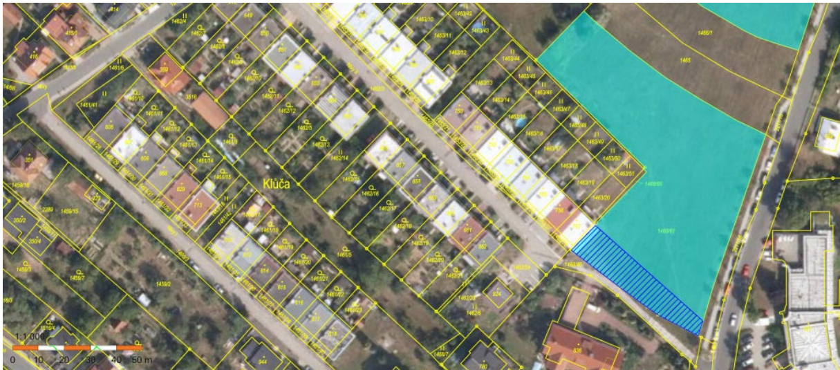
Část pozemků č.2