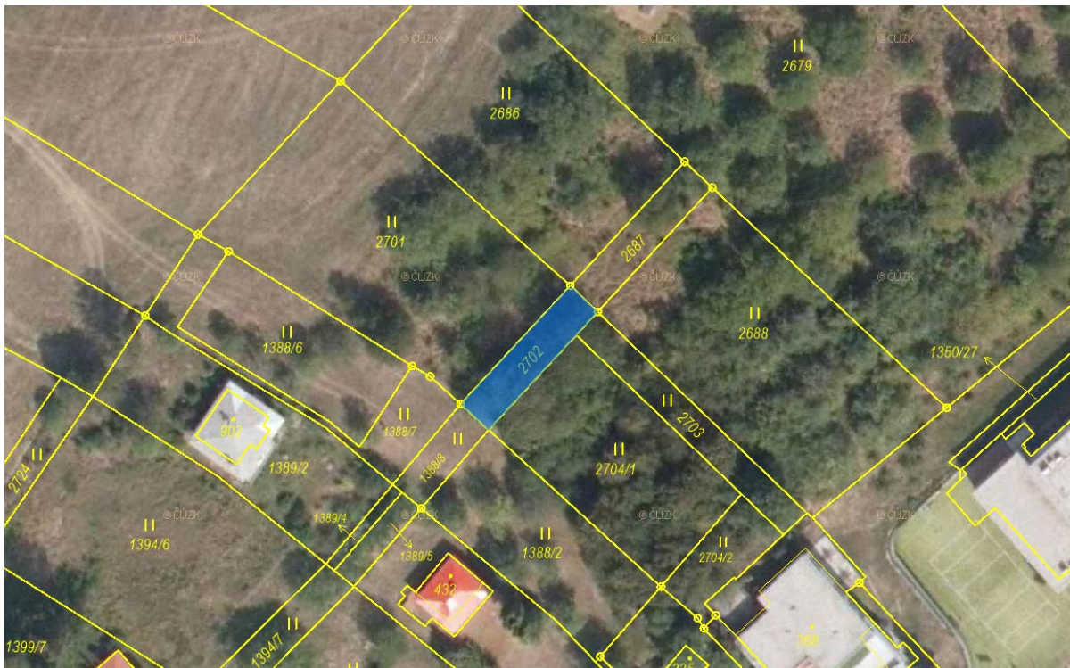
parc. č. 2702