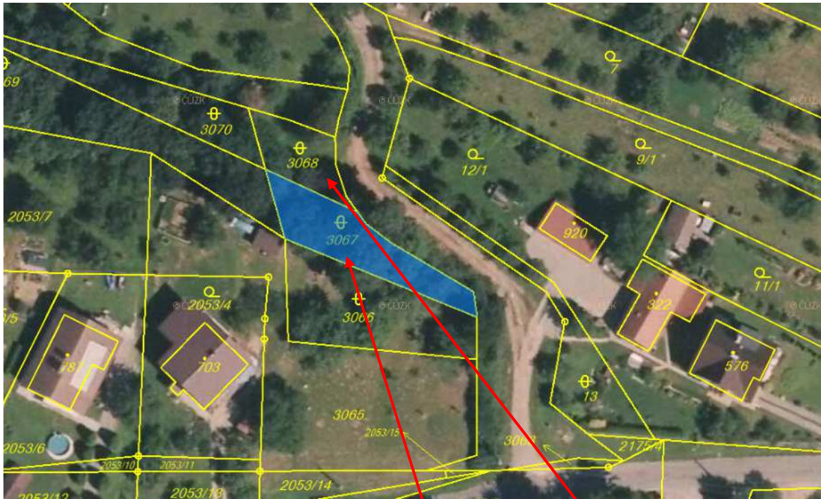
Pozemky parc. č. 3067 a parc. č. 3068