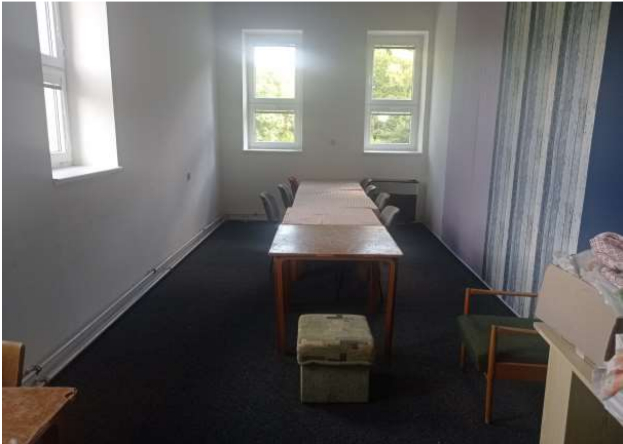
Obrázek 2: Místnost 204 před rekonstrukcí