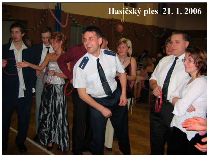
Hasičský ples 21. 1. 2006

A na co se můžeme připravit v jarních měsících? Kromě příprav na 100. výročí založení sboru, které