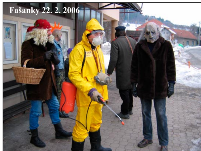
Fašanky 22. 2. 2006

a pódium. A právě pódium bylo nejvíce ohroženým místem a jeho úklid byl proveden „za pět minut dvanáct“. Následné tání bylo naštěstí pozvolné a k ohrožení tající vodou v obci nedošlo. Měsíc leden bývá již tradičně spojen s hasičským plesem, letos v pořadí již šestnáctým. Obrovský zájem a kladné ohlasy nás utvrdily v tom, že patříme mezi kvalitní akce tohoto druhu. S příchodem poslední soboty před dobou postní vstoupil do obce Fašankový průvod, vedený skupinkou