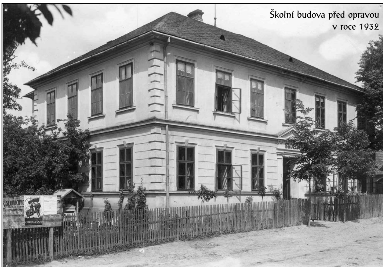
Školní budova před opravou v roce 1932

Škola ... je to jen jedno slovo a kolik vyvolá v každém z nás pocitů, vzpomínek a úvah. Ta naše - Základní škola v Pozlovicích - slaví letos významné jubileum 110 let.