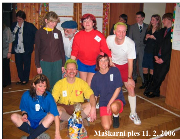
Maškarní ples 11. 2. 2006