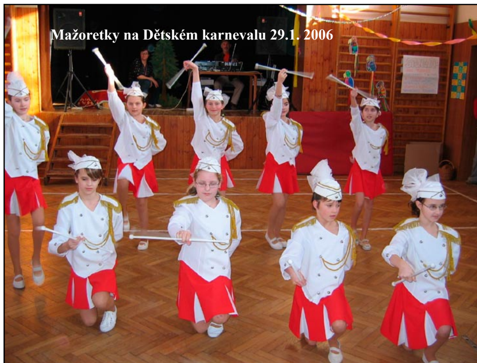
Mazoretky na Dětském karnevalu 29.1. 2006

gymnázium, do sportovní školy nebo do tříd s rozšířenou výukou matematiky. Úspěšnost přihlášených je velmi dobrá.