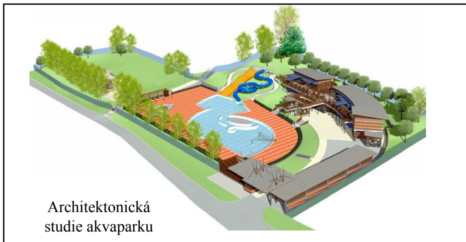
Architektonická studie akvaparku

③ V rámci přípravy projektů pro rozvoj cestovního ruchu byla vypracována architektonická studie na akvapark za 95 200,- Kč, dokumentace pro územní řízení a dokumentace k posouzení vlivu stavby na životní prostředí za 556 800,- Kč a doklady k žádosti o dotace - analýza nákladů a výnosů, studie proveditelnosti - 65 000,- Kč. Na projekt byla poskytnuta dotace ve výši 200 000,- Kč Zlínským krajem, 347 000,- Kč, z MMR ČR, z toho polovina z této dotace bude do rozpočtu obce poukázána po předložení žádosti o dotaci na vlastní realizaci stavby. Inženýrská činnost k vydání územního rozhodnutí byla provedena ve vlastní režii.