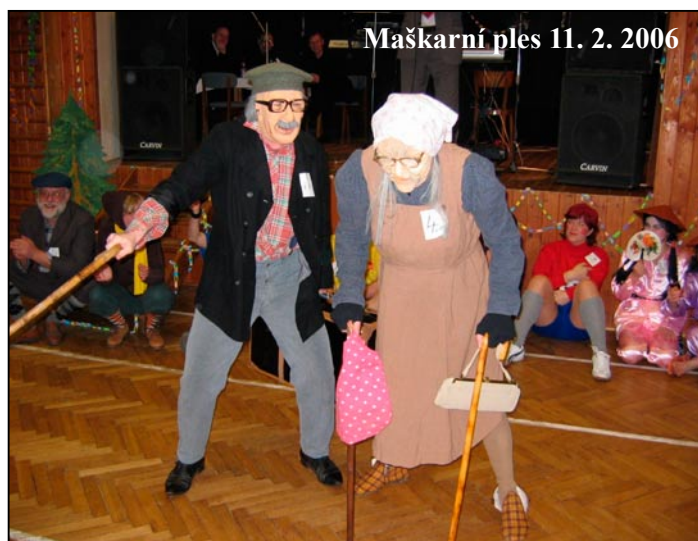
Maškarní ples 11. 2. 2006