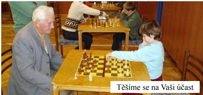
Těšíme se na Vaši účast

Prezentace bude od 8:00 v tělocvičně, turnaj začíná v 8:30.