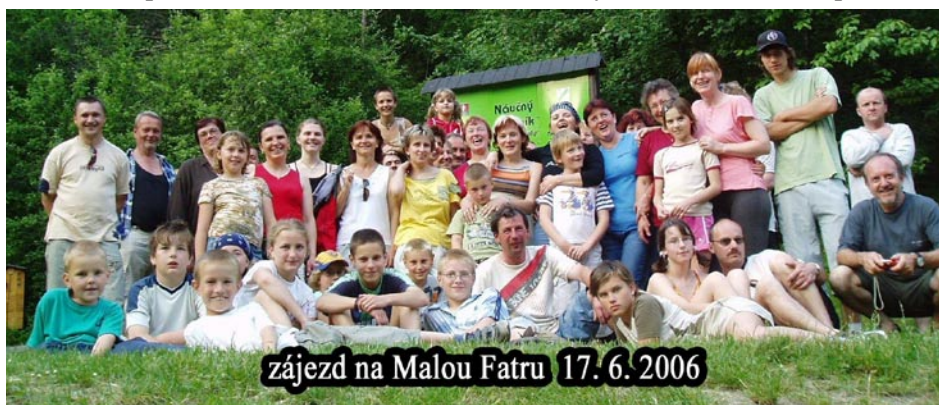
zájezd na Malou Fatru 17. 6. 2006

Je před námi poslední naše letošní akce, a to Junácké vánoce. Zaneseme lesním zvířátkům, co mají rády a u živého stromu se rozloučíme s rokem. Koledy, dárečky a k nebi naše světlice, aby se lidé navzájem měli rádi!