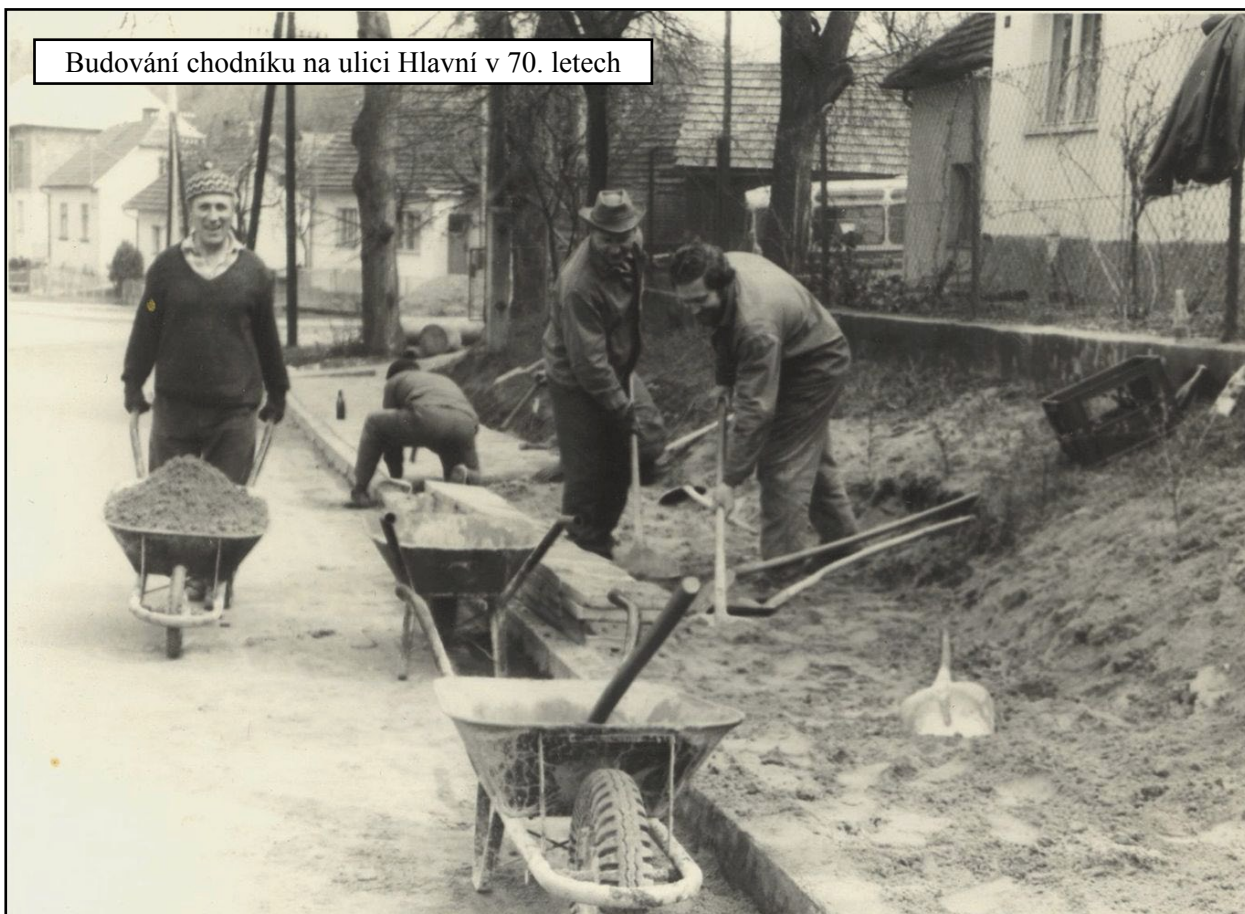
Budování chodníku na ulici Hlavní v 70. letech

Chodníky jsou neustále aktuálním tématem. Rekonstrukce v ulici Hlavní a Leoše Janáčka je hlavní investiční akcí, která nás čeká v letošním roce.