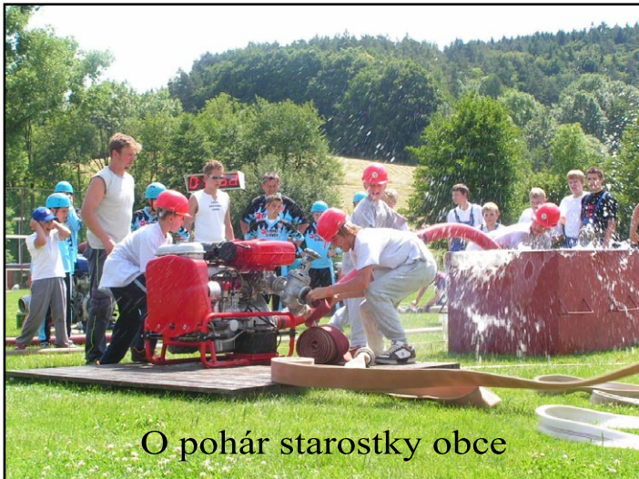
O pohár starostky obce

zásahovou přilbu. Tyto oděvy dlouho nečekaly na svůj „křest“. Dne 19.7. v 14:57 byl vyhlášen poplach lesního porostu v Luhačovicích nad Aloiskou. Tím se odstartovala další řada zásahů v průběhu jednoho měsíce. Hned 25.7. v 2:09 oznámila siréna výjezd k RD v ulici Nivy I., kde došlo k požáru