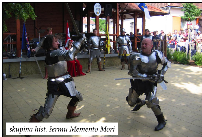
skupina hist. šermu Memento Mori