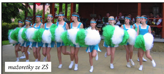
mažoretky ze ZŠ