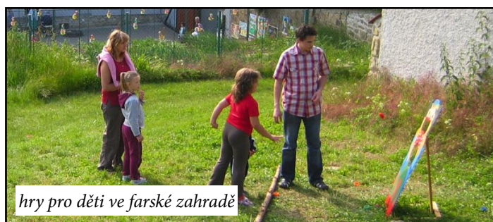
hry pro děti ve farské zahradě