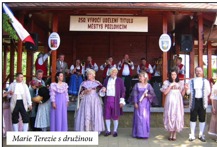
Marie Terezie s družinou