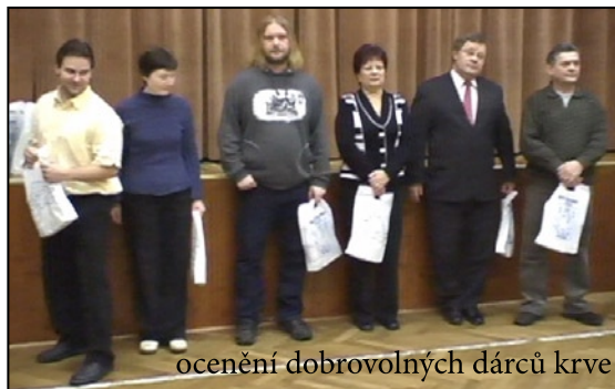
ocenění dobrovolných dárců krve

Děkujeme našim dárcům za jejich záslužnou aktivitu, kterou pomáhají zachraňovat životy naši spoluobčanů.