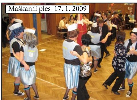
Maškarní ples 17. 1. 2009

Novinkou pro letošní rok má Sokol v plánu uspořádat v měsíci červnu akci s názvem „Městys Pozlovice v pohybu“. Jedná se o začlenění všech sportovců a občanů, kteří se mohou přihlásit do turnajových soutěží, které budou probíhat v jeden den na všech sportovištích v Pozlovicích. Tato akce je ovšem závislá na podpoře jak sponzorů, tak dotací, o které bylo zažádáno. V případě poskytnutí výše uvedené dotace budeme včas naše občany a sportovce informovat.