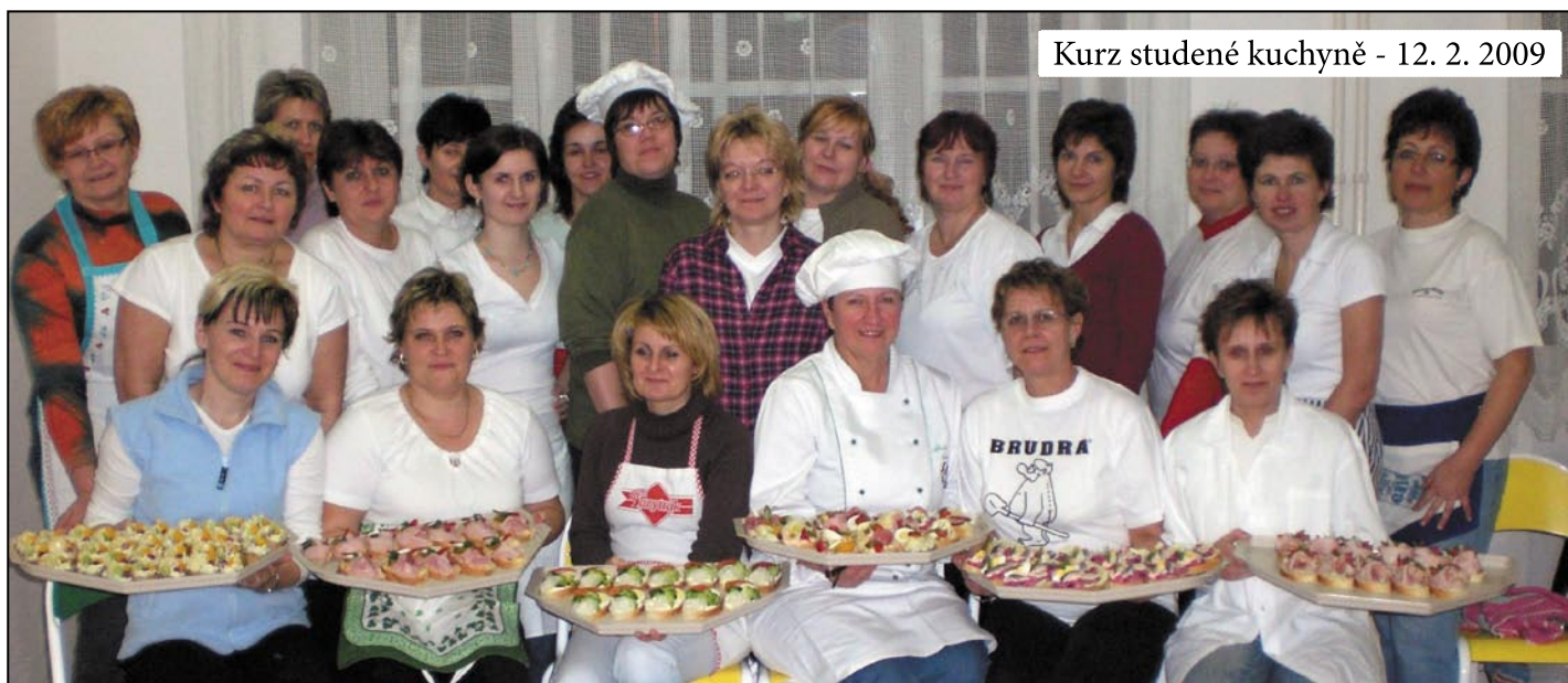
Kurz studené kuchyně - 12. 2. 2009

V květnu tuto akci společně se všemi organizátory vyhodnotíme v hostinci U Krajců. Zde taky popřejeme všem našim sestřám k případnému kulatému životnímu jubileu. Rády bychom upozornily naše spoluobčanky i spoluobčany, že na podzim se chystáme uspořádat výstavku ručních prací. Proto, co se vám hezkého podaří vyrobit, nerozdávejte a nechejte pro svou prezentaci.