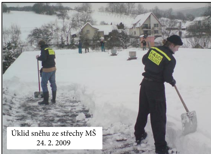
Úklid sněhu ze střechy MŠ 24. 2. 2009