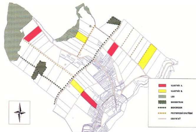
barevné provedení na www.pozlovice.cz/obcasnik