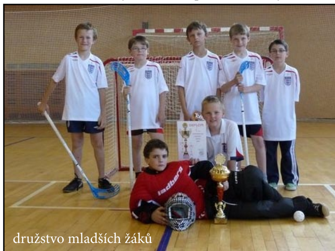
družstvo mladších žáků

Poděkování patří všem, kteří se zasloužili o uspořádání a zdárný průběh celého turnaje. Děkanátní turnaj finančně podpořil i Zlínský kraj.