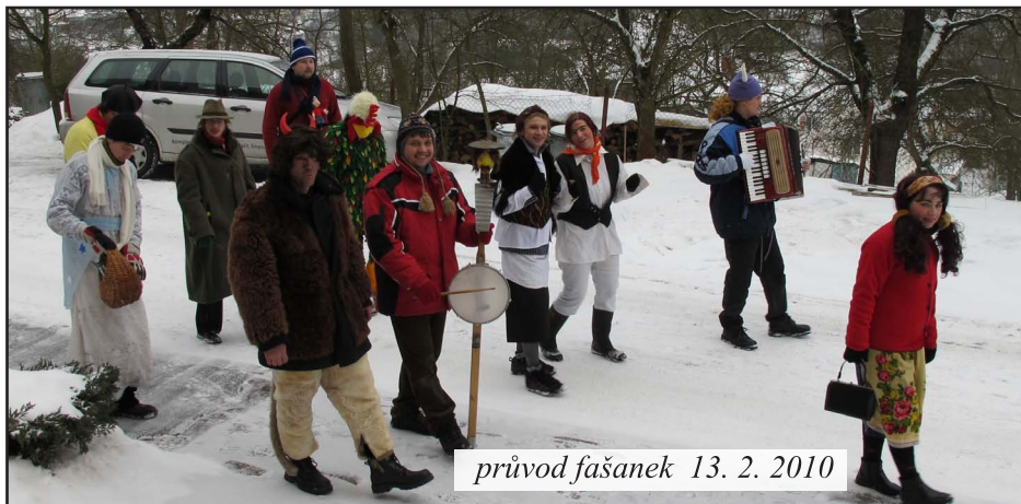
průvod fašanek 13. 2. 2010

Jelikož se blíží jarní počasí a nastane tradiční úklid zahrad a větví ze stromů, je potřeba při jejich pálení dbát zvýšené opatrnosti a pokud se bude pálit větší hromada, je možné toto pálení nahlásit přes novou aplikaci na internetových stránkách HZS Zlínského kraje - http://paleni.hzszlk.eu/ . Toto ohlášení je možné provést i telefonicky. Jeho význam spočívá v tom, že při ohlášení požáru v nahlášené lokalitě je možné kontaktovat zodpovědnou osobu za pálení a tím zamezit zbytečným výjezdům hasičů. Pro fyzické osoby je to nepovinné (pouze doporučené), ale pro firmy povinné. Podrobnější informace na odkazu http://www.hzs-zlkraje.cz/clanek/848/hasici-pripravili-novy-portal-k-hlaseni-paleni-odpadu/ .