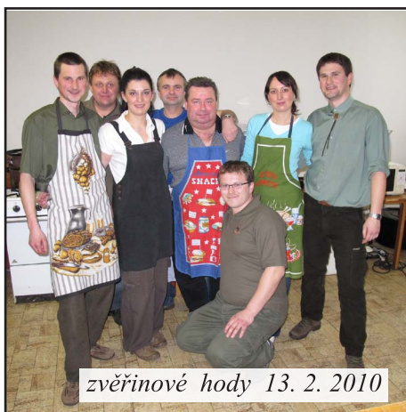
zvěřinové hody 13. 2. 2010

Děkujeme všem, kteří nám pomáhali s přípravou a také všem návštěvníkům za účast!