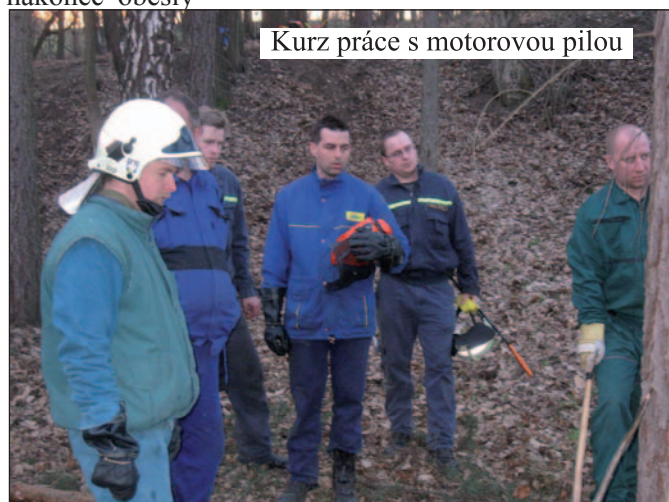
Kurz práce s motorovou pilou

Závěrem bych si Vás dovilil pozvat dne 27. 6. od 9:00 hod. na cvičiště za mateřskou školku, kde se uskuteční další ročník dětské soutěže „O pohár starostky městyse Pozlovice“.