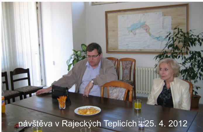
návštěva v Rajeckých Teplících 25. 4. 2012

Žáci 5. třídy pod vedením tř. učitelky zpracovali tematické práce, jejichž úkolem bylo bližší poznání partnerských míst Pozlovice a Rajecké Teplice. Úkolem bylo určit místo, kde se teoreticky setkají vody z Luhačovické přehrady a jezera v Rajeckých Teplících, jaké jsou možnosti tras mezi oběma místy, jak pro automobilovou dopravu, tak pro cyklisty nebo pro pěší turisty. Tematické práce žáci tvořili ve skupinách. Nejlepší práce budou zaslány do školy v Rajeckých Teplících, odkud nám zase zašlou práce jejich žáků o Pozlovicích.