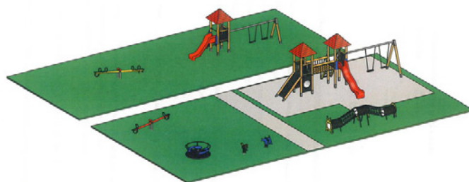
vizualizace hracích prvků

Ministerstvo pro místní rozvoj podpořilo tento náš záměr a na rekonstrukci a dovybavení dětského hřiště nám byla schválena dotace ve výši 296 tis. Kč. Celkové rozpočtové náklady činí 423 tis. Kč. Realizace je plánována na období letních prázdnin t. r.