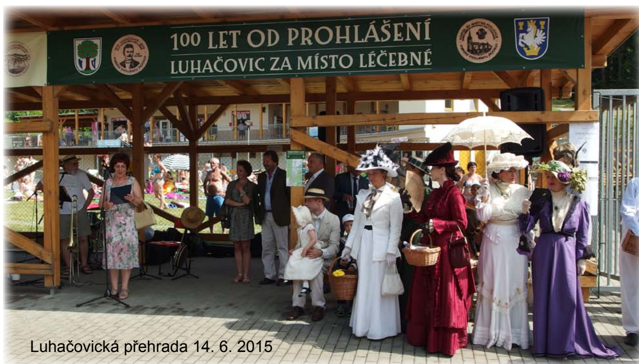
Luhačovická přehrada 14. 6. 2015