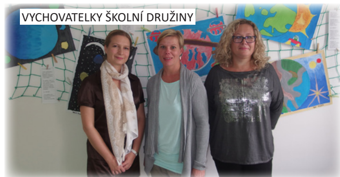
VYCHOVATELKY ŠKOLNÍ DRUŽINY