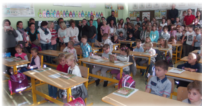
Zahájení školního roku 2017/2018 v ZŠ Pozlovice, kdy do 1. třídy nastoupilo 23 prvňáčků.