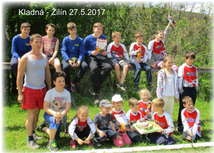
Kladná - Žilín 27.5.2017

I přes letošní velmi suché počasí trávající celé jaro i léto jsme naštěstí nemuseli zasahovat u požárů ve volné přírodě. Nicméně to neznamená, že bychom nemuseli vůbec vyjíždět. Nejdříve dne 6. 5. 2017 v 9:35 hodin došlo oznámení o požáru chaty na Lipskách, ale nakonec našeho zásahu nebylo zapotřebí, jelikož se jednalo o nenahlášené pálení rostlinných zbytků poblíž budovy. Další vyhlášený výjezd se uskutečnil 17. 6. v 18:09 hodin do Luhačovic k ohlášenému požáru bytu v panelovém domě. V tomto případě jsme byli při cestě k zásahu odvoláni, jelikož se jednalo pouze o grilování na balkóně. O několik dní později, 21. 6. v 12:31 hodin byl opět vyhlášen jednotce poplach, tentokrát do Podhradí – Penzionu u Kúdelků. Z tohoto výjezdu se nakonec „vyklubalo“ prověřovací cvičení řízené HZS. Poslední výjezd mimo naši obec byl 4. 7. v 10:16 hodin výjezd do Luhačovic, kde došlo ke vznícení jídla na vařiči. To nejhorší nás ovšem čekalo v sobotu 22. 7. odpoledne. I když meteorologové předpovídali silný déšť s možností