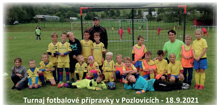
Turnaj fotbalové přípravy v Pozlovicích - 18.9.2021