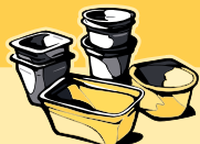
kelímky od jogurtů, krabičky od pokrmových tuků

PET láhve, prosím, seřadíte - nezabouřte v kontejneru tolik místa.