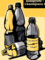
plastové nádoby a láhve, PET láhve (od nápojů)