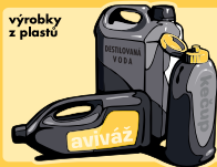
výrobky z plastů