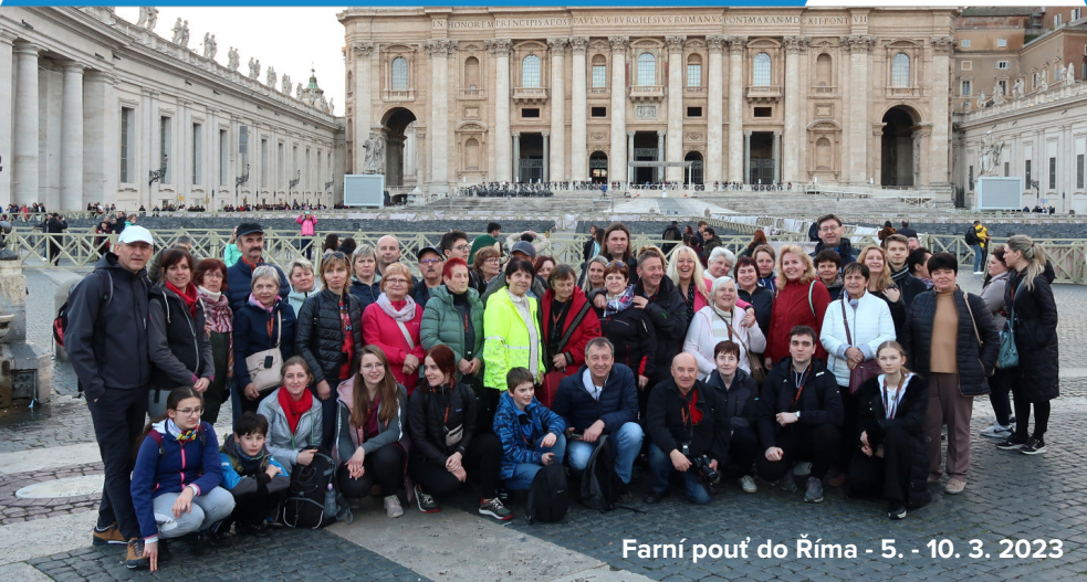
Farní pouť do Říma - 5. - 10. 3. 2023